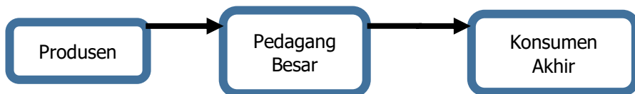
Gambar 3. Saluran Pemasaran Pupuk Bioslurry Cair Metroganik III Pada CV Harapan Bersama

Saluran pemasaran III atau saluran pemasaran satu tingkat, merupakan pola saluran pemasaran yang melalui perantara yaitu pedagang besar. Saluran pemasaran ini dimulai dari produsen ke pedagang besar dan konsumen akhir, maka dapat di sajikan pada gambar 3.