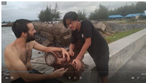
Gambar 2. Komunikasi Turis Yang Menetap dan Penduduk Lokal

Disini peneliti juga mengetahui, pada dasarnya memang turis maupun penduduk lokal sama sama bisa menjadi komunikator dan juga komunikan sesuai dengan keperluan saat melakukan interaksi antara turis asing ke penduduk lokal maupun sebaliknya. Sama halnya dengan pengidentifikasian komunikator, maka pengidentifikasian komunikan terlihat adanya interaksi yang dilakukan oleh turis dan penduduk lokal, dimana posisi komunikan disini adalah penerima pesan.