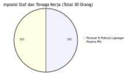
Gambar 3 : Komposisi Staf dan Tenaga Kerja

Berdasarkan hasil wawancara dan observasi, peneliti menemukan bahwa: