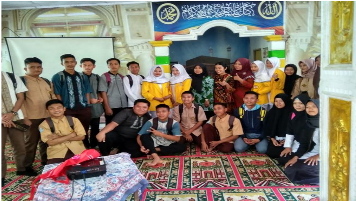
Gambar 2. Pembentukan PIK-KRR