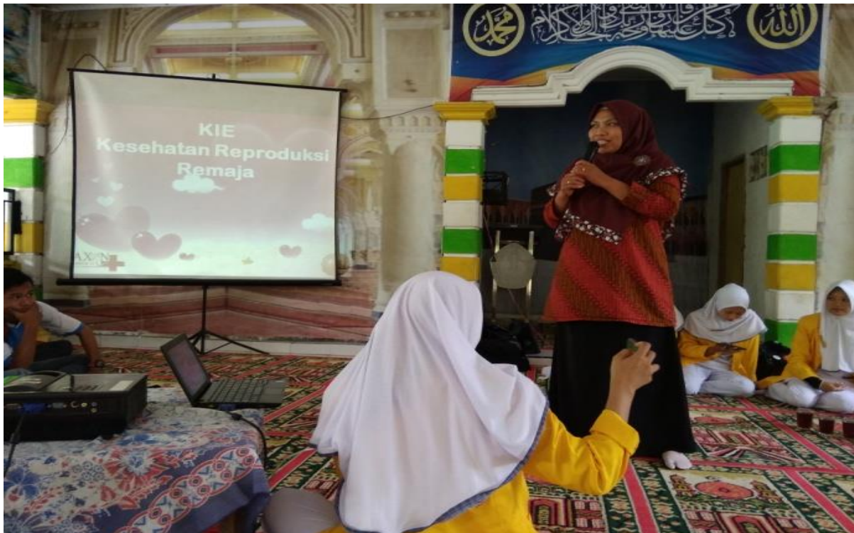
Gambar 1. Kegiatan Peningkatan Kespro Remaja Melalui Peran PIK-KRR

PIK-KRR merupakan wadah dalam memberdayakan aktivitas remaja dalam menjaga kesehatan reproduksinya, dalam peningkatan kesehatan reproduksinya perlu dilakukan kerjasama lintas program dan lintas sektoral baik instansi kesehatan maupun non kesehatan, banyak hal yang dapat dilakukan dalam organisasi ini, diantaranya dapat bermanfaat menjadi wadah kegiatan remaja yang positif, dapat mengembangkan minat dan bakat siswa terutama bidang kesehatan, membantu program pemerintah bidang kesehatan reproduksi remaja pada tahap promotive dan preventif.