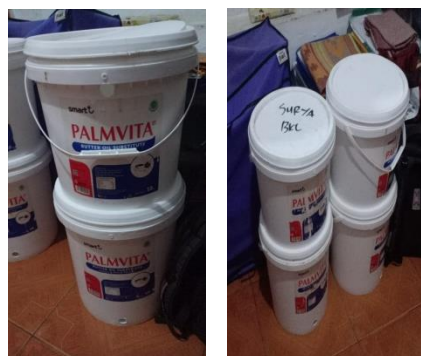
Gambar 3. 1. Gambar Model Ember Tumpuk (Komposter) Tampak Luar (sumber : Pengolahan Data, 2021)

Ember atas disiapkan dengan membuat lubang-lubang kecil (diameter 5 mm) sebanyak mungkin pada bagian bawah untuk pengatusan. Lubang kecil dibuat sebanyak empat buah (diameter 5 mm), pada bagian samping atas ember di bawah tutup. Fungsi lubang kecil tersebut untuk mengatur sirkulasi udara dan tempat masuk telur atau larva muda yang baru saja menetas. Fungsi ember di atas sebagai penampung sampah yang diolah.