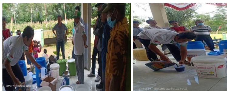
Gambar 3. 2. Proses Pelarutan Molase Nira Aren untuk Pembuatan Bakteri Indigeneous Microorganisme Lokal dan Pembuatan Eco Enzyme

Eco-enzyme adalah cairan hasil fermentasi antara limbah dapur, seperti kulit buah atau sayur-sayuran dengan air dan gula. Proses fermentasi ini memanfaatkan enzim dari sampah dapur agar dapat digunakan untuk berbagai kebutuhan. Eco-enzyme sendiri ditemukan dan dikembangkan oleh Dr. Rosukon Poompanvong, pendiri dari Asosiasi Pertanian Organik Thailand. Beliau aktif melakukan penelitian mengenai enzim selama lebih dari 30 tahun.