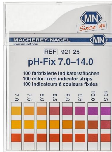
Gambar 3. 5. Kertas Test Strips pH Fix