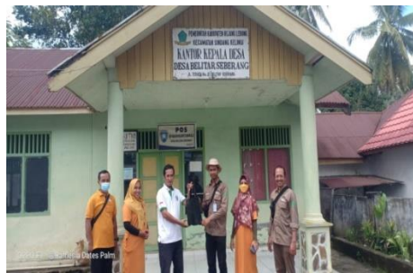
Gambar 3.6. Foto Bersama di Lokasi Depan Kantor Balai Desa dan Bank Sampah Belirang Desa Belitar Seberang