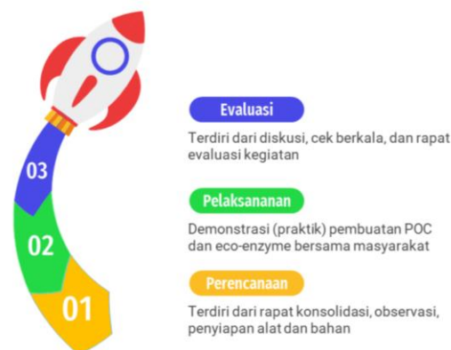
Gambar 2. 1. Kerangka Kegiatan Pengabdian kepada Masyarakat (sumber : pengolahan data, 2021)

Seperti dijelaskan pada bagian sebelumnya bahwa pengabdian dilakukan dalam tiga tahapan utama dengan tetap mengikuti Protokol Kesehatan Covid-19, secara ringkas dapat dilihat pada gambar di bawah ini;