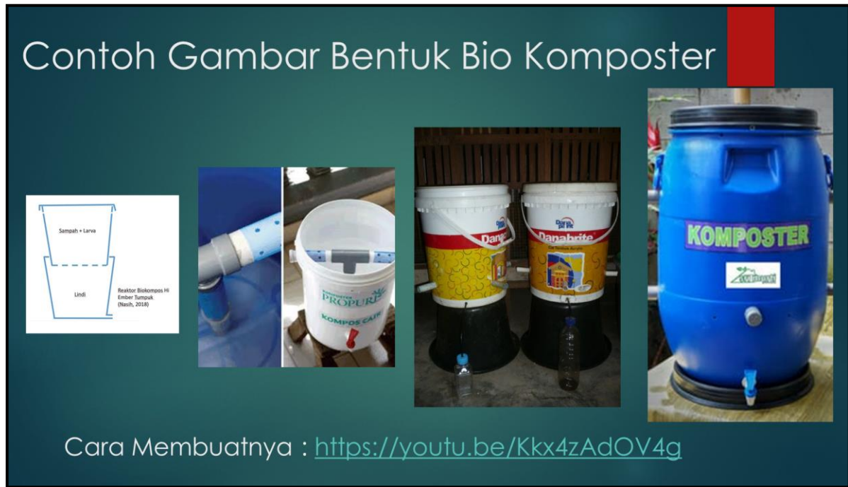
Gambar 8. Alat Produksi Bio Composter