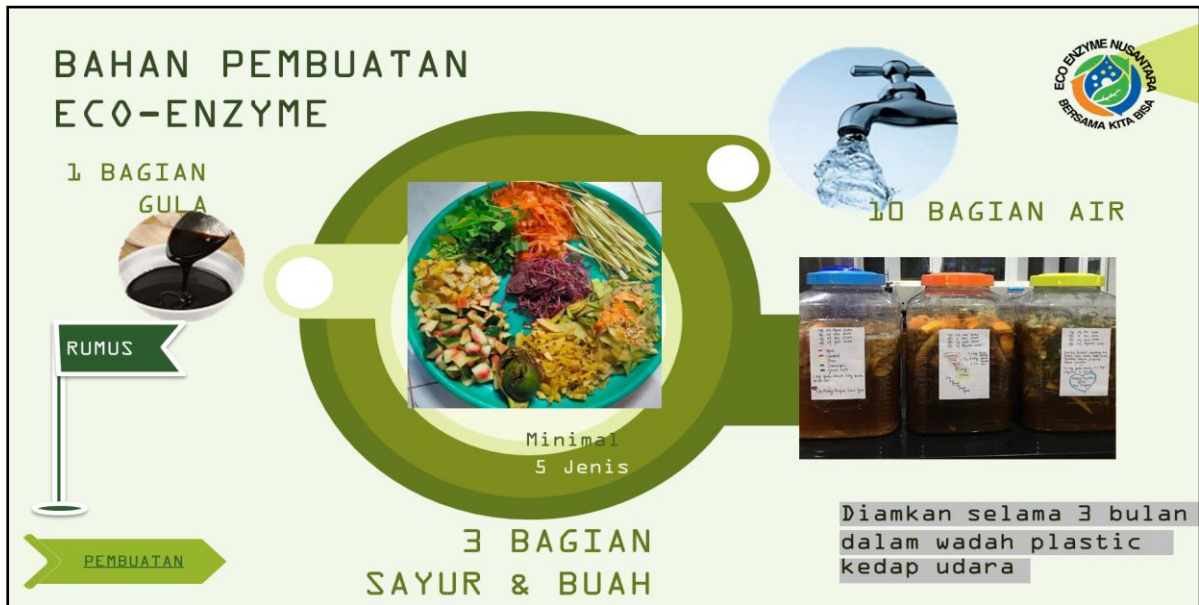
Gambar 6. Bahan Bahan Pembuatan Eco Enzyme