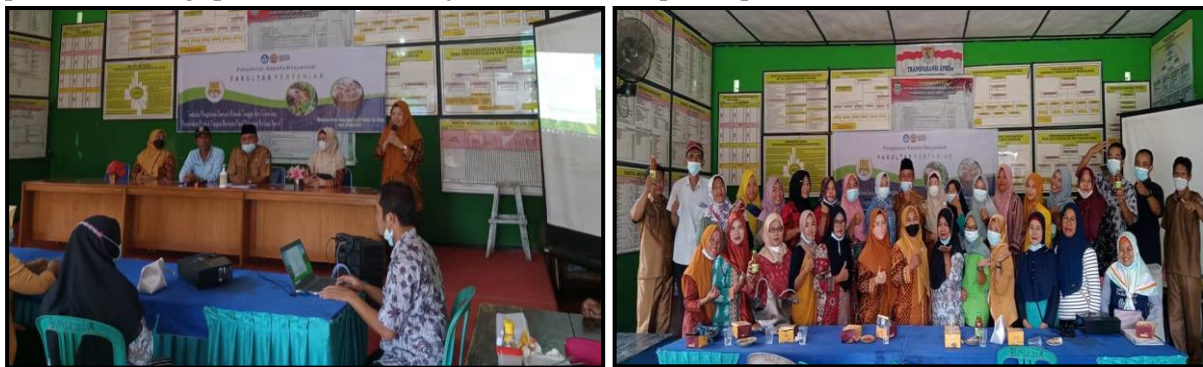
Gambar 5. Pelatihan Strategi Pemasaran Dimsum Jamur Sawit

Untuk strategi pemasaran, pemateri memberikan gambaran dan materi bagaimana strategi yang baik dalam memasarkan produk pangan secara offline maupun online . Peserta diberikan pelatihan pemasaran dengan sosial media. Saat ini aplikasi media sosial bukanlah hal yang tabu, hampir semua remaja sampai lansia sudah menggunakan teknologi digital untuk mengakomodasi komunikasi baik dengan sanak keluarga maupun dengan rekan kerja atau rekan sekolah dahulu. Sehingga sosial media dapat menciptakan tren dan menjadi sebuah potensi untuk media pemasaran. Dalam memasarkan produknya mitra dapat mengupload sesering mungkin produknya ke sosial media. Sosial media yang dapat digunakan yakni Whatsapp, Facebook, Instagram dan lain lain. Mitra juga wajib mengupload kesan baik dari pelanggan yang telah membeli produknya untuk menarik pelanggan lain. Selain itu dapat memberikan penghargaan kepada konsumen yang telah membagikan testimoni terkait produk yang kita jual ke media social mereka. Dengan pemasaran yang baik jangan lupa untuk selalu memperbaiki pelayanan dan kualitas produk, karena pemasaran yang baik harus menciptaka nilai dan keuntungan bagi pembeli (Kotler dan Gery, 2013). Dokumentasi kegiatan pelatihan strategi pemasaran dimsum jamur sawit ditampilkan pada Gambar 5.