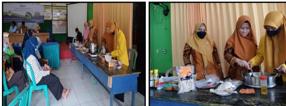
Gambar 2. Penyuluhan dan Pelatihan Teknologi Pengolahan Dimsum Jamur Kelapa Sawit

Dalam proses pengolahan produk ini, peserta langsung mempraktikkan penanganan yang benar, mulai dari sortasi bahan baku jamur, pemotongan menjadi ukuran yang lebih kecil, pencampuran dengan bahan pendukung hingga pengukusan. Setelah itu semua peserta mencicipi hasil olahan jamur dan 99% dari peserta memberikan nilai 9 dari 10. Untuk masa simpan dimsum jamur sawit telah diuji dan bertahan selama 6 bulan hingga di freezer (Prasetya et al, 2019). Dokumentasi kegiatan penyuluhan dan pelatihan teknologi pengolahan dimsum jamur kelapa sawit disajikan pada Gambar 2.