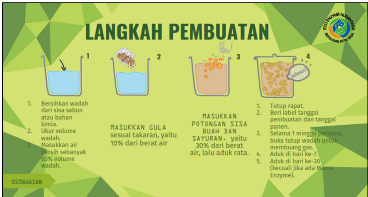
Gambar 7. Langkah Langkah Pembuatan Eco Enzyme

Selain praktik perakitan instalasi peralatan yang dibutuhkan, dilakukan juga praktik pembuatan pupuk organik menggunakan ember tumpuk, serta contoh produk yang siap konsumsi dan siap dipasarkan. Dokumentasi kegiatan penyuluhan dan pelatihan pengelolaan sampah menjadi pupuk organik dan eco enzyme serta serah terima instalasi alat produksi bio komposter disajikan pada Gambar 8.