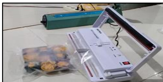
Gambar 4. Alat Vacuum Sealer untuk Kemasan Dimsum Jamur Tiram