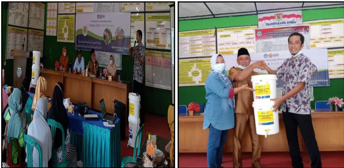
Gambar 9. Penyuluhan dan Pelatihan Pengelolaan Sampah Organik serta Serah Terima Alat Produksi Bio Composter