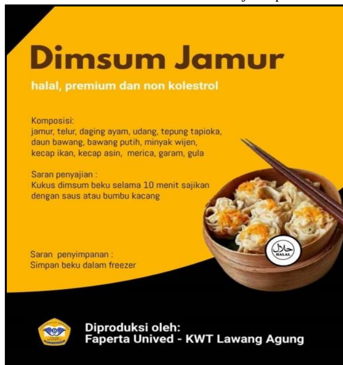
Gambar 3. Desain Kemasan Dimsum Jamur Sawit

Dalam kegiatan penyuluhan dan pelatihan desain kemasan dan strategi pemasaran produk dimsum jamur sawit, peserta diberikan materi bagaimana mendesain kemasan yang baik, apa saja informasi yang harus ditampilkan pada kemasan pangan, serta teknik memilih kemasan yang cocok untuk produk yang dikemas. Desain kemasan produk dimsum jamur sawit disajikan pada Gambar 3, sedangkan contoh desain kemasan dan alat vacuum sealer disajikan pada Gambar 4.