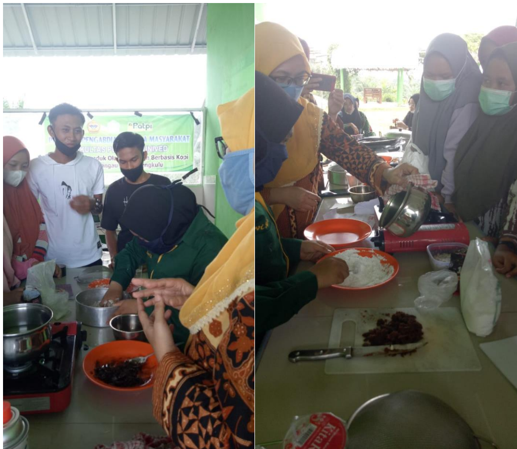
Gambar 2. Praktik pengolahan klepon kopi

Sosialisasi dan pelatihan pengolahan klepon kopi berupa ceramah dan praktek pengolahan klepon kopi, dimana siswa-siswa SMK Agribisnis Dangau Datuk juga terlibat langsung dalam pengolahan (Gambar 2).