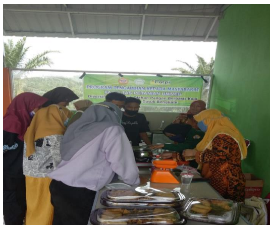
Gambar 1. Praktek pengolahan selai kopi

Produk selai dari kopi dipasaran masih belum banyak sehingga menjadi peluang bagi masyarakat untuk menciptakan produk salah satunya dengan tambahan kopi. Produk ini mudah dipelajari serta dipraktekkan dengan bahan yang mudah didapat, alat yang digunakan sederhana dan proses pengolahan yang mudah. Sosialisasi dan pelatihan pengolahan selai kopi berupa ceramah dan praktik pengolahan selai kopi, dimana siswa-siswa SMK Agribisnis Dangau Datuk juga terlibat langsung dalam pengolahan (Gambar 1).