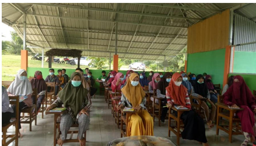
Gambar 3. Sosialisasi pengemasan dan pemasaran produk pangan olahan kopi

Pemasaran dalam bisnis adalah mutlak harus dilakukan atau kegiatan utama selain produksi yang berguna untuk menjaga kelangsungan usahanya dan mendapatkan keuntungan (Dwinora et al., n.d.). Sosialisasi pemasaran produk penting juga dilakukan karena sebagai upaya strategi pemasaran yang tepat, sehingga pemasaran produk selai kopi dan klepon kopi tepat sasaran dan meningkatkan jumlah penjualan. Pemasaran yang tepat tergantung dari sasaran penjualan yang dituju dan perlu meramalkan harga kopi dunia dan domestic dengan beberapa model agar mampu menjelaskan penjualan dalam jangka panjang (Novanda et al., 2018). Sosialisasi pengemasan dan pemasaran dilakukan dengan cara penyampaian materi atau ceramah dan tanya jawab oleh siswa-siswa SMK Agribisnis Dangau Datuk, Kota Bengkulu. Para siswa-siswa SMK Agribisnis Dangau Datuk antusias dalam sosialisasi pengemasan dan pemasaran produk pangan olahan dari kopi tersebut (Gambar 3).