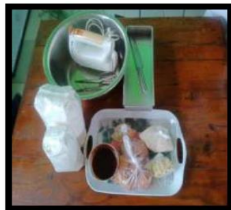
Alat dan bahan yang disiapkan