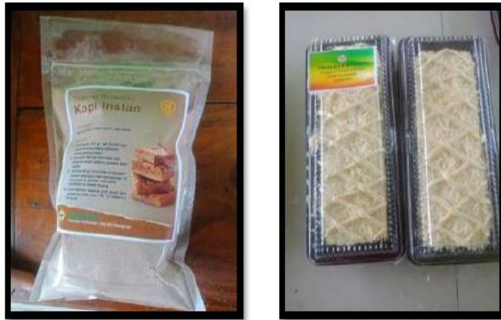
Gambar 4. Contoh Kemasan Tepung Brownis (Kiri) dan Brownis (Kanan)

al., (2018) menyatakan bahwa nilai tambah sebuah produk menjadi berkali lipat dengan menambahkan kemasan yang menarik Jenis kemasan yang diperkenalkan pada kegiatan ini adalah kemasan plastik mika. Noviadji (2014) menyatakan bahwa kemasan buatan manusia seperti kertas, plastik, kaleng, dan styrofoam menciptakan kesan modern, praktis, dan bersih.