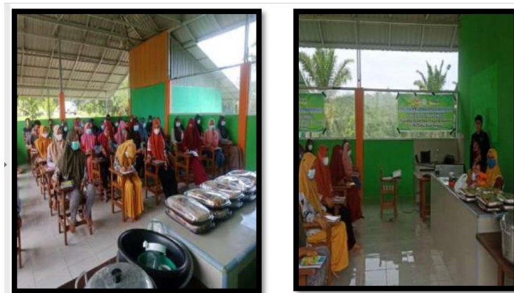
Gambar 1. Peserta Kegiatan

Kegiatan bertujuan untuk memberikan penyuluhan dan sosialisasi kepada siswa-siswi SMK Dangau Datuk Kota Bengkulu bahwa bubuk kopi memiliki potensi untuk diolah menjadi produk makanan seperti brownies, teknologi pengolahan serta pengemasan brownies kopi. Tim pengabdian menginformasikan bahwa saat ini telah banyak produsen kue yang menambahkan bubuk kopi pada produk seperti brownies, sus, dan lain-lain dengan tujuan menambah varian rasa. Menurut beberapa hasil penelitian, sebagian besar panelis menyukai produk-produk kue yang ditambahkan kopi pada proses pengolahannya (Sabara et al. , 2017). Penyuluhan dan sosialisasi dapat dilihat pada Gambar 1.