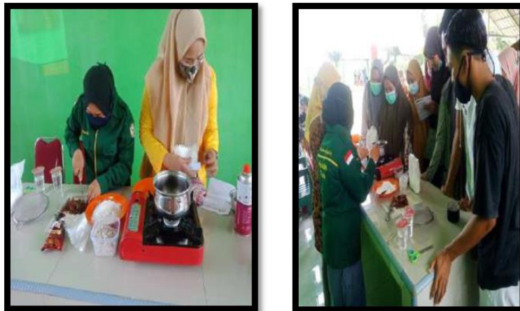
Gambar 2. Mahasiswa dan Siswa Sedang Terlibat dalam Pembuatan Brownies Kopi Alat alat yang dipersiapkan adalah :