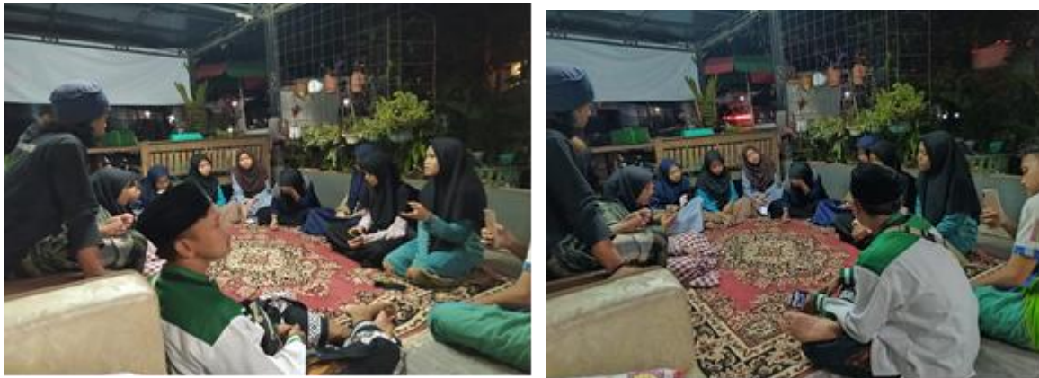
Gambar 4. Kegiatan FGD ( Forum Group Discussion ) bersama Irema.

Keempat , tahap pelaksanaan program mengaji bareng irema (NGARIMA). Program ini dilaksanakan pada sore hari, yakni setelah berjamaah magrib sampai setelah salat berjamaah isya. Dengan adanya program NGARIMA (Mengaji Bareng Irema) yang dilakukan setelah salat maghrib, terjadi perubahan secara perlahan. Yakni, awal mula program ini dibuat, anak usia sekolah dasar yang mengaji hanya berjumlah 6 orang. Namun, dengan berjalannya waktu jumlah anak usia sekolah dasar senantiasa bertambah menjadi 51 orang bahkan lebih.