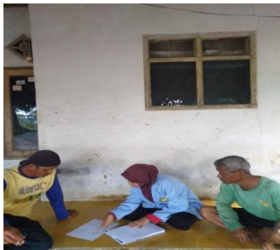
Gambar 3. Wawancara dan kegiatan sensus anak yang tidak mengaji.

Ketiga , pelaksanaan mendata anak usia sekolah dasar yang tidak mengaji dilingkungan RW 06.