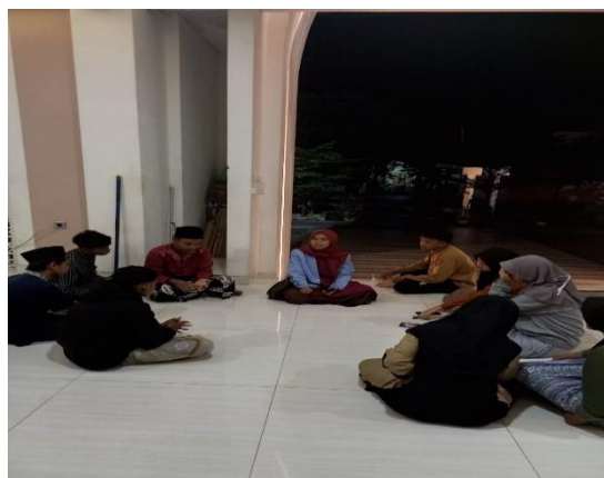
Gambar 1 Kumpulan bersama Ikatan Remaja Masjid

Pertama , pada tahap perencanaan peneliti mengumpulkan remaja yang ada dalam wadah irema tersebut untuk membicarakan mengenai beberapa langkah yang akan dilakukan dalam menjalankan program NGARIMA.