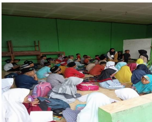
Gambar 7. Kegiatan Pesantren Ramadan

Dalam pelaksanaan program ini, ketika bulan ramadan, maka peneliti bersama remaja yang ada dalam IREMA tersebut, membuat program PASARMA (Pesantren Ramadan bareng irma). Biasanya PASARMA ini dilakukan secara bersama-sama dalam satu tempat yakni Masjid yang menjadi central kegiatan. Namun, karena jarak anak-anak yang terlalu jauh, maka peneliti bersama IREMA membuat kelas jauh untuk PASARMA yakni ditiap mushola yang jaraknya jauh. Seperti RT 17, RT 20. Hal tersebut dilakukan, agar anak-anak senantiasa mengaji terus walaupun dalam keadaan bulan ramadan.