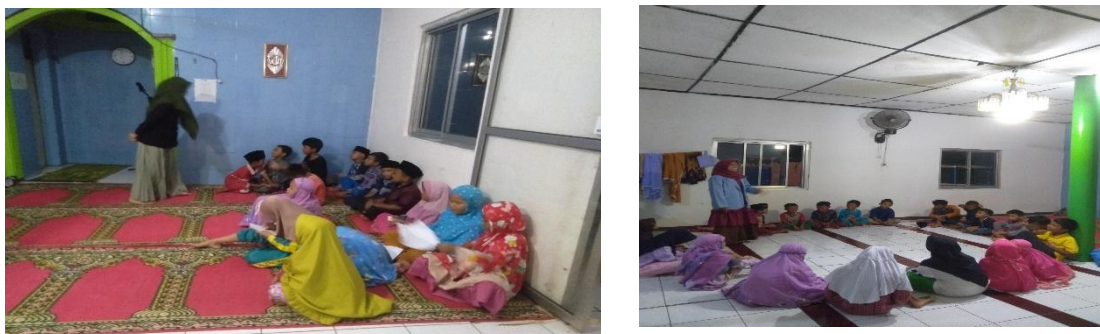
Gambar 5. Kegiatan di musala RT 17

Keempat , tahap pelaksanaan program mengaji bareng irema (NGARIMA). Program ini dilaksanakan pada sore hari, yakni setelah berjamaah magrib sampai setelah salat berjamaah isya. Dengan adanya program NGARIMA (Mengaji Bareng Irema) yang dilakukan setelah salat maghrib, terjadi perubahan secara perlahan. Yakni, awal mula program ini dibuat, anak usia sekolah dasar yang mengaji hanya berjumlah 6 orang. Namun, dengan berjalannya waktu jumlah anak usia sekolah dasar senantiasa bertambah menjadi 51 orang bahkan lebih.