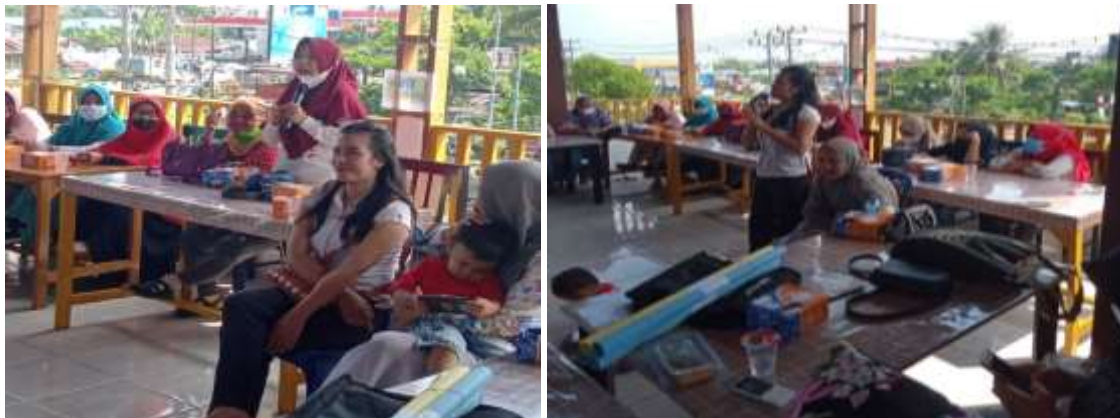
Gambar 4. Tanya Jawab Pelaku Usaha

Pada metode ini tercipta kedekatan antara pemateri dan peserta yang tujuannya agar dapat terjalin interaksi antara pembicara dengan para pelaku bisnis. Ada beberapa manfaat dari pendekatan ini, yaitu 1) menciptakan pembelajaran interaktif karena melibatkan peserta, 2) dapat meningkatkan motivasi peserta karena menggabungkan pola pikir peserta, dan 3) manfaat lainnya dapat meningkatkan pemahaman peserta tentang pengukuran materi yang dibahas, hal ini dapat dijadikan sebagai perbaikan mendasar dalam proses belajar mengajar. Pada sesi ini pelaku usaha tidak sungkan untuk bertanya baik mengenai pengetahuan maupun saran, yang dapat di lihat pada gambar 4.