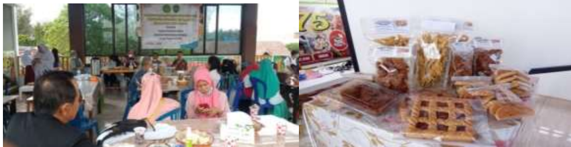
Gambar 6. Focus group discussion