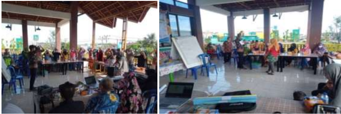
Gambar 3. Penyampaian Motivasi oleh Motivator

Pada metode ini tercipta kedekatan antara pemateri dan peserta yang tujuannya agar dapat terjalin interaksi antara pembicara dengan para pelaku bisnis. Ada beberapa manfaat dari pendekatan ini, yaitu 1) menciptakan pembelajaran interaktif karena melibatkan peserta, 2) dapat meningkatkan motivasi peserta karena menggabungkan pola pikir peserta, dan 3) manfaat lainnya dapat meningkatkan pemahaman peserta tentang pengukuran materi yang dibahas, hal ini dapat dijadikan sebagai perbaikan mendasar dalam proses belajar mengajar. Pada sesi ini pelaku usaha tidak sungkan untuk bertanya baik mengenai pengetahuan maupun saran, yang dapat di lihat pada gambar 4.