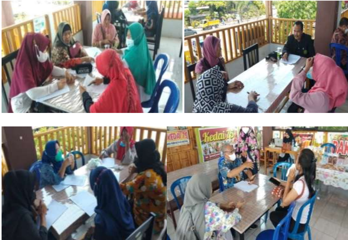
Gambar 5. Pelaku Usaha bersama Instruktur

berkelanjutan untuk menumbuhkan pola pikir dan budaya bisnis, kreativitas dalam desain produk, menyerap kemajuan teknologi, dan pengetahuan dan keterampilan manajemen, sesuai dengan Lingkungan bisnis yang terus berubah (Susita, 2017).