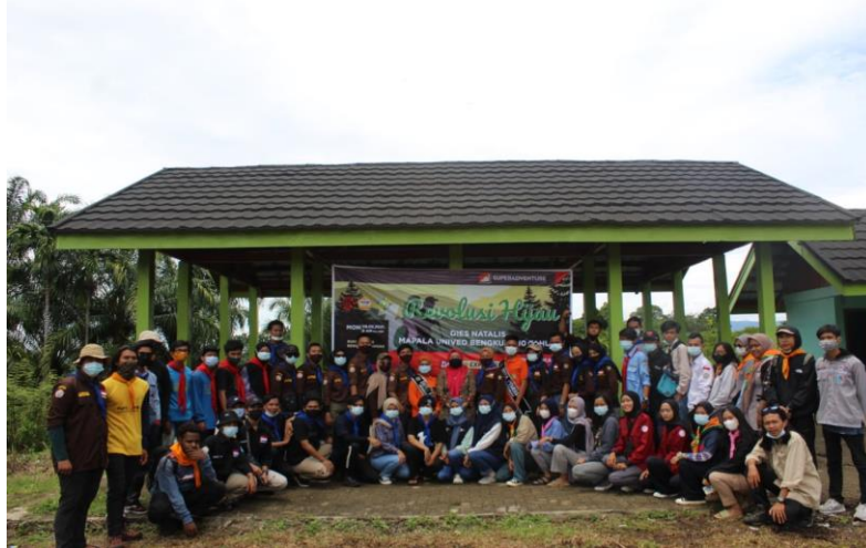
Gambar 4. Dokumentasi Kegiatan Literasi Media dan Jurnalisme Warga

Kegiatan penyuluhan dan pelatihan berjalan dengan lancar sesuai dengan jadwal dan tujuan yang diharapkan dengan mematuhi protokol kesehatan. Dan untuk tetap mengasah kreatifitas pemuda desa maka dilakukan pendampingan, dimana tim pelaksana akan membuka ruang konsultasi terkait informasi yang diterima atau menyebar di Desa Durian Demang. Selain itu, juga dibuka ruang bagi remaja untuk mempublikasikan berita yang mereka buat melalui media yang dikelola oleh Program Studi Ilmu Komunikasi Universitas Dehasen Bengkulu yaitu Media Online ctzonedehasenbkl.com dan Radio Dehasen 88,5 FM sebagai wadah penyaluran ilmu yang dipeoleh.