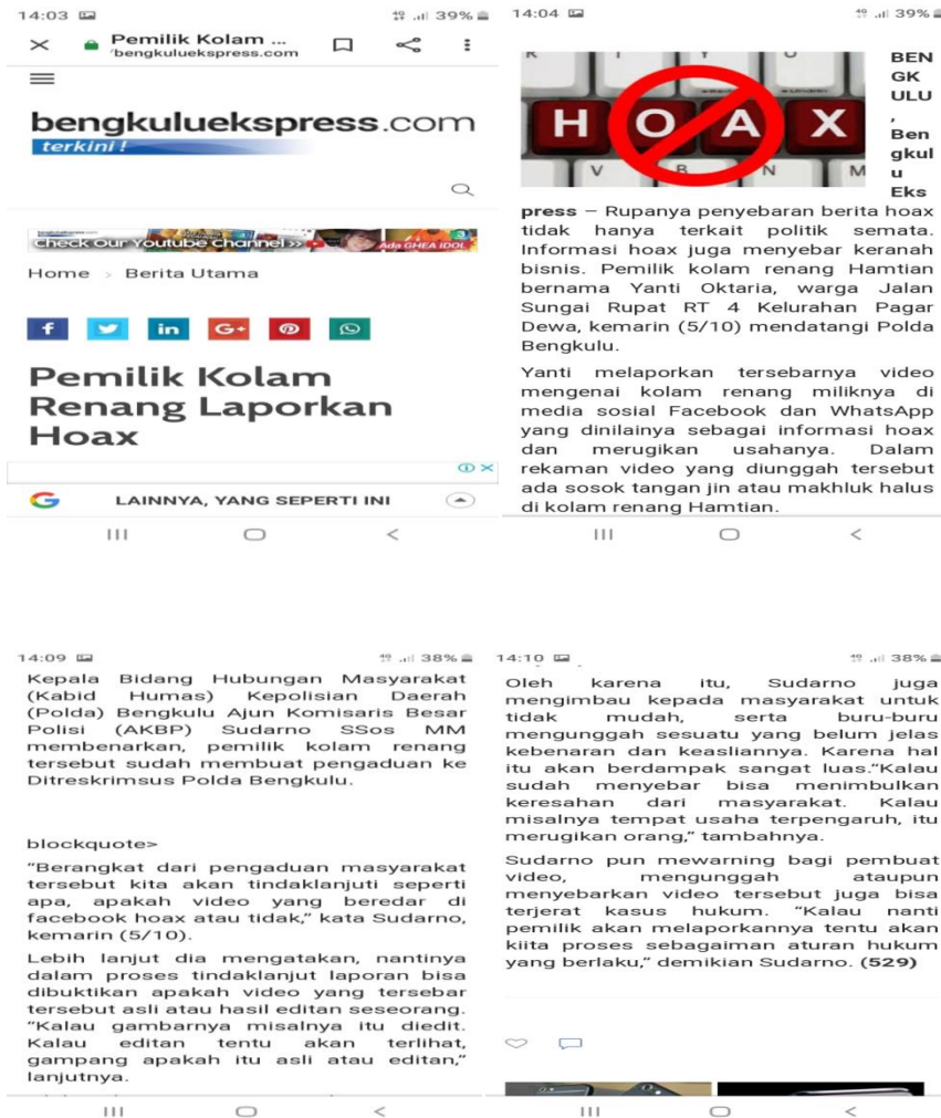
Gambar 1. Berita Masyarakat Terkena Berita Hoax

Kasus hoax telah berkembang di Indonesia, bahkan sudah merambah ke daerah-daerah. Salah satunya di Provinsi Bengkulu. Terdapat beberapa kasus hoax yang sangat menyita perhatian masyarakat di Bengkulu. Pertama, salah satu masyarakat di kota Bengkulu terkena berita hoax sehingga mengalami kerugian materi.