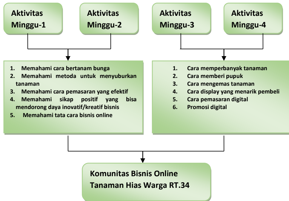
Gambar 2. Skema Pendampingan kegiatan