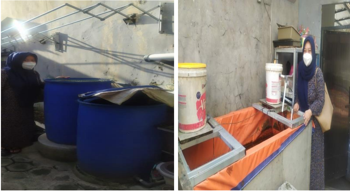
Gambar 1. Bak Penampungan