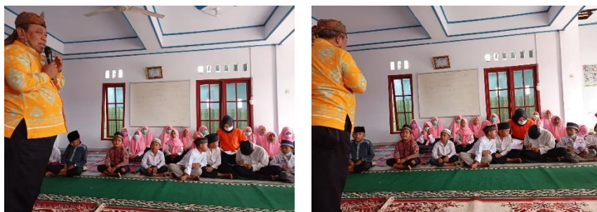
Gambar 3. Aktivitas Pengabdian