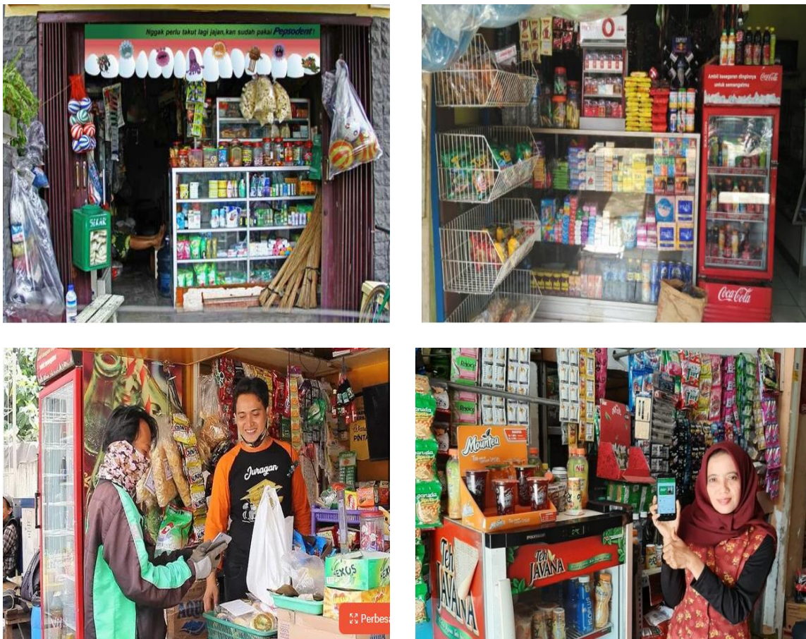
Gambar 2. Gerakan belanja di warung tetangga

Kesadaran untuk belanja ke sesama tetangga adalah modal terpenting untuk membangun kesejahteraan bersama. Sebab uang berputar di kalangan mereka sendiri. Produksi menjadi bangkit bersama-sama ekonomi warga menggeliat penghasilan mulai tampak meningkat dan dukungan sosial di antara mereka semakin dekat karena interaksi yang intensif saling (Basri, 2002). Hal ini menjadi modal sosial yang sangat mahal untuk membangun kesejahteraan bersama di antara RT 34 Komplek Green Palm Estate.