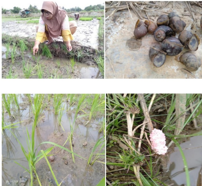
Gambar 1. Survey dan Analisis Situasi

Keong mas ( Pomacea Canali Culata Lamarck ) adalah molusca air tawar dan hama penting bagi tanaman padi. Banyaknya keong mas di desa ini, menimbulkan kreatifitas UMKM Sejahtera untuk mengolah keong mas menjadi abon, namun terkendala teknologi pembuatan dan pemasaran. Masalah yang sama dalam pengembangan Usaha Kecil Menengah antara lain masih lemahnya tingkat kemampuan, keterampilan, keahlian, dan manajemen. Lemahnya kemampuan manajemen ini mengakibatkan pengusaha kecil tidak mampu mengelola usahanya dengan baik (Kuncoro, 2006).