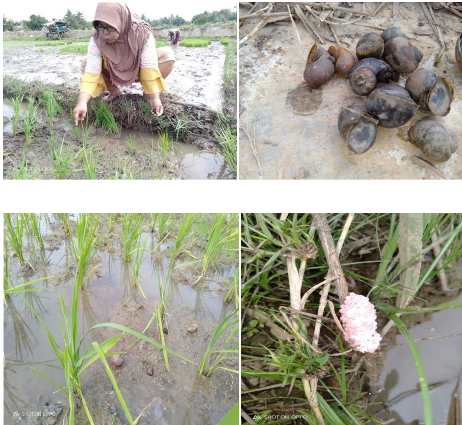
Gambar 1. Survey dan Analisis Situasi

Keong mas ( Pomacea Canali Culata Lamarck ) adalah molusca air tawar dan hama penting bagi tanaman padi. Banyaknya keong mas di desa ini, menimbulkan kreatifitas UMKM Sejahtera untuk mengolah keong mas menjadi abon, namun terkendala teknologi pembuatan dan pemasaran. Masalah yang sama dalam pengembangan Usaha Kecil Menengah antara lain masih lemahnya tingkat kemampuan, keterampilan, keahlian, dan manajemen. Lemahnya kemampuan manajemen ini mengakibatkan pengusaha kecil tidak mampu mengelola usahanya dengan baik (Kuncoro, 2006).