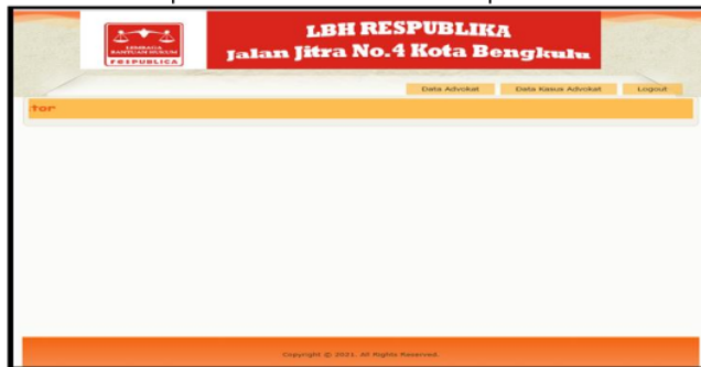
Gambar 3. Halaman Administrator

Merupakan halaman yang dapat diakses oleh admin yang menampilkan sub menu pengolahan data. Adapun halaman administrator seperti Gambar 3.