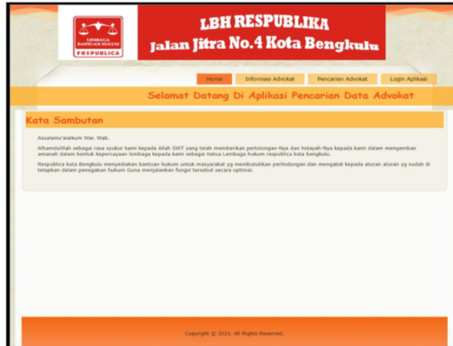
Gambar 6. Halaman Home

Merupakan halaman yang dapat diakses oleh masyarakat dengan memberikan informasi kata sambutan dari LBH Republica Kota Bengkulu. Adapun halaman home, seperti Gambar 6.