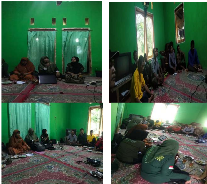
Gambar 2. Pendidikan dan penyuluhan

untuk memberikan pemahaman pada masyarakat mitra dan pihak terkait tentang kegiatan PKM dengan menyampaikan maksud, tujuan, dan target kegiatan dalam Pendampingan Kelompok Tani Melalui Pembuatan MOL (Mikro Organisme Lokal) dan Pengolahan Limbah Sawit Sebagai Pakan Ternak Berbasis Ekonomi Produktif Di Desa Sidorejo. Dari kegiatan sosialisasi program disepakati bahwa semua kegiatan yang akan dilaksanakan di rumah sekretaris desa Sidorejo sebagai penanggung jawab lokasi. Semua anggota kelompok ikut berpartisipasi dalam kegiatan ini.