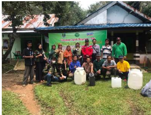
Gambar 3. Demonstrasi dan Pelatihan

Kegiatan ini mampu meningkatkan pengetahuan dan motivasi anggota kelompok tani mitra, hal ini terlihat pada antusias peserta pada sesi diskusi dan tanya jawab. Kegiatan pendidikan dan penyuluhan ini diawali dengan sambutan dari kepala desa, kemudian sambutan dari dosen peternakan universitas muhammadiyah bengkulu, dan selanjutnya presentasi materi dari tim pelaksana program serta diakhiri dengan sesi diskusi dan tanya jawab.