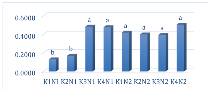
Gambar 2. Perbedaan berat basah perkecambah kailan pada interaksi pemberian amelioran lokal dan varietas dibandingkan yang tanpa diberi perlakuan amelioran pada tanah pascatambang timah

Keterangan: Nilai yang diikuti oleh huruf yang sama dalam satu kolom tidak berbeda secara signifikan pada p < 0,05 menurut Uji Rentang Berganda Duncan (DMRT)