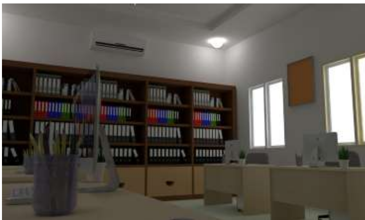
Gambar 3. Sudut kiri luar ruang kerja area kantor lantai 2