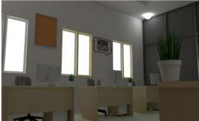
Gambar 4. Sudut kanan dalam ruang kerja area kantor lantai 2