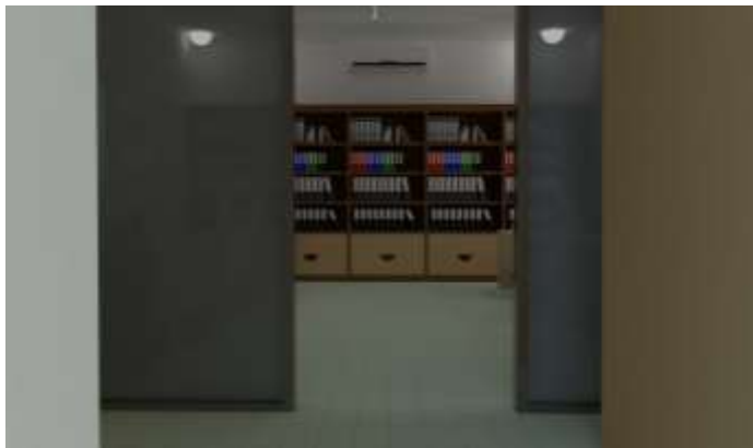
Gambar 6. Tampak luar ruang kerja area kantor lantai 2