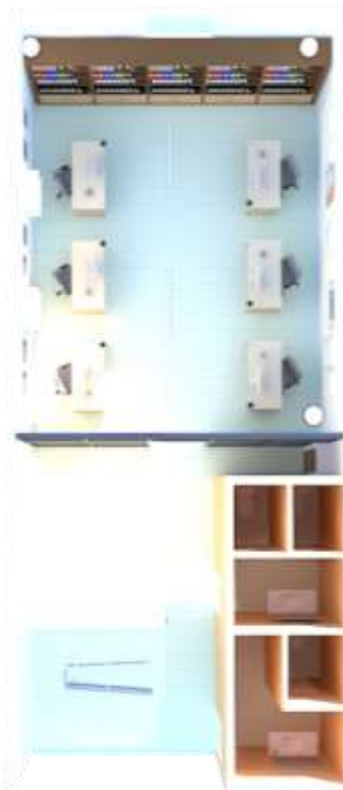
Gambar 7. Tampak atas ruang kerja area kantor lantai 2