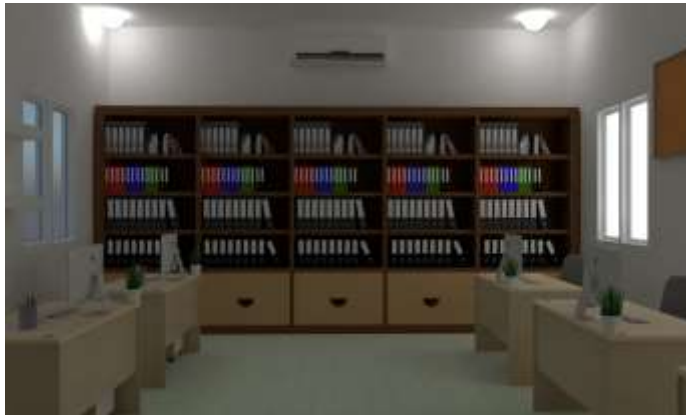
Gambar .5. Tampak dalam ruang kerja area kantor lantai 2 (Sumber : PT. Bluesope Lysaght Medan, 2022)