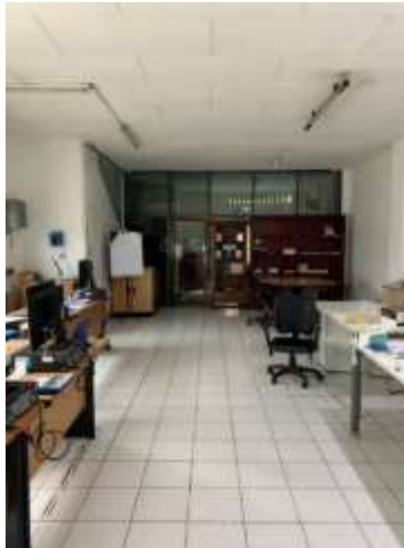
Gambar 1. Area kantor lantai 2 PT. Bluescope Lysaght Medan

Karena lantai dua ini difokuskan untuk pekerja jadi sebagai upaya meningkatkan efisiensi ruang untuk meningkatkan kenyamanan dan produktivitas kerja di ciptakan keputusan menerapkan konsep “Minimalis”. Desain yang paling signifikansi, tampil sederhana, tidak banyak hiasan pada ruang bangunan. Menggunakan konsep ini juga menampilkan elemen bangunan yang seperlunya saja sesuai dengan fungsinya dan sesederhana mungkin yang akan muncul kesan estetik dan elegan.